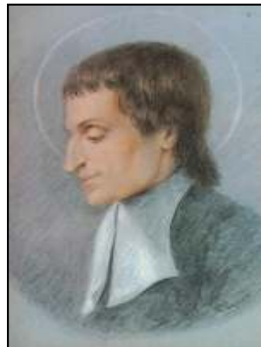
San Lluís Maria de Montfort 1673-1716

Et demanem, Déu i Pare Nostre, que segons la vostra misericòrdia i la vostra promesa, no ens faltin mai pastors com el nostre Fundador, Sant Lluís Maria Grignon de Monfort, exemple de cristià compromès i al servei de l'Evangeli, exemple d'aquell qui, per Amor a Crist, serveix als pobres.