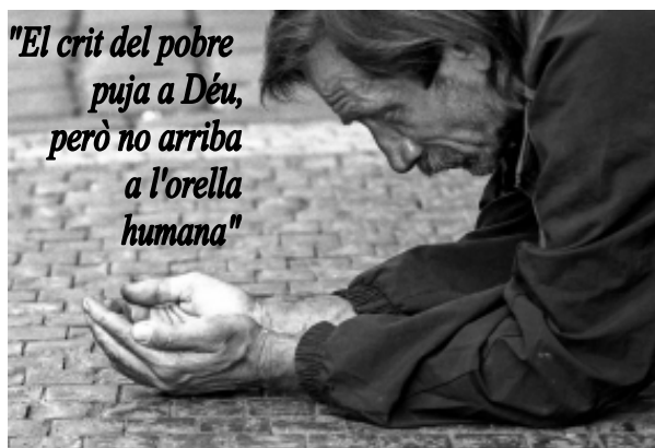
Juan María de la Mennais

Verge Maria, fes que el nostre cor es trasbalsi davant de qui pateix. No deixis que restem indiferents davant la misèria que sovint ens envolta. La indiferència ens resta humanitat. T'ho demanem des del nostre cor. Amén.