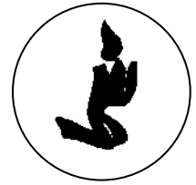
espai de pregària

Demà, divendres 30 de novembre , torna l' Espai de Pregària . Tots els divendres lectius, de 8.30 a 8.45 h, us oferim un temps de pregària dinamitzat per l'Equip de Pastoral i dirigit a tothom que hi vulgui participar. A la Capella del Col·legi (accés Gran Via).